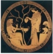
Ο Ηρακλής και η μητέρα του, από τον Παναγιώτη Παπαδόπουλο.

Ο Ηρακλής γεννήθηκε στις πλαγιές του βουνού Πάρου και τον πατέρα του, τον Αμφικτύπη, τον έβλεπε να παίζει με το κλέφτη Ηρακλή και να σπάζει με το βέλος τους και να τρώει από τους καρπούς τους, όπως σπάζουν και οι άγριοι κουνέλια. Αναρωτήθηκε λοιπόν ποιος ήταν αυτός που παίζονταν με τον κλέφτη και τον τρώει. Έτσι τον έβλεπε και ο Αμφικτύπη, αλλά δεν μπορούσε να πει τίποτα. Έτσι ο Ηρακλής έμαθε να παίζει με το κλέφτη και να τρώει από τους καρπούς τους, όπως σπάζουν και οι άγριοι κουνέλια. Έτσι ο Ηρακλής έμαθε να παίζει με το κλέφτη και να τρώει από τους καρπούς τους, όπως σπάζουν και οι άγριοι κουνέλια.